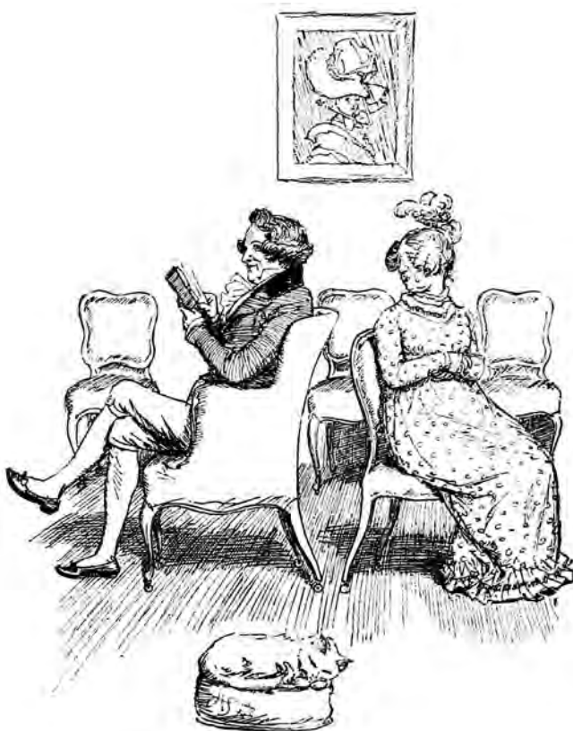
Domnul și doamna Bennet.

— Consider că-ți faci inutil probleme. Și mai cred că domnul Bingley se va bucura tare mult să vă vadă. Uite, ca să te conving de buna mea credință, am să-i trimit prin dumneata câteva rânduri prin care am să-l asigur că n-am să mă împotrivesc nici-cum să o ia pe oricare dintre fete îi va plăcea mai mult; deși poate că ar trebui să strecor o vorbă bună pentru micuța mea Lizzy.